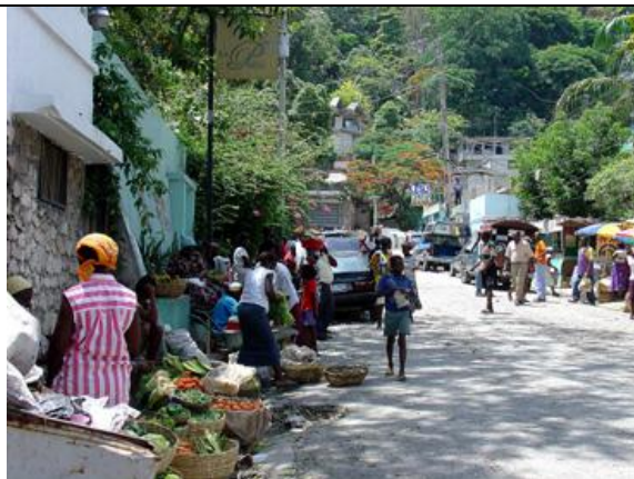
Pétion-Ville, marché de rue