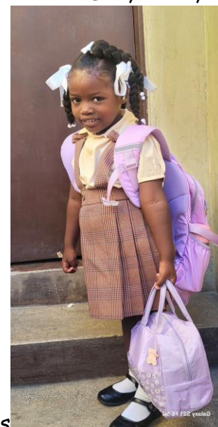
Sephora, 4 ans