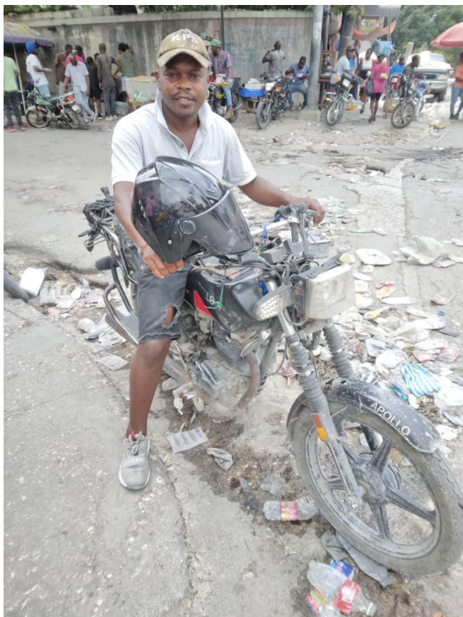
Dieulin, taxi moto