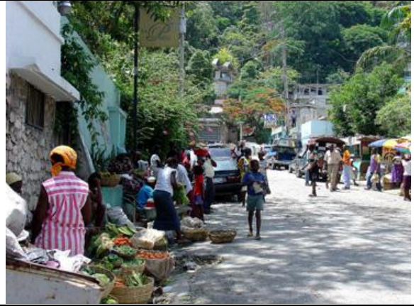
Pétion-Ville, marché de rue